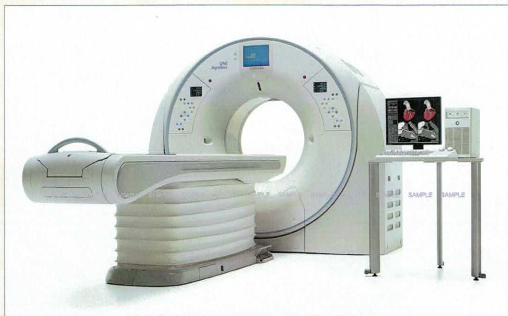
■ 東芝Area Detector CTスキャナ

当院では、今までの1回転で16cmという広範囲の撮影を可能にした、320列面検出器を搭載し、一度に広範囲を短時間で撮影できるCT装置を設置しております。撮影時間が短くなることで、放射線被曝や造影剤の使用量も低減し、患者様の負担が少なくなります。さらに3D画像に時間軸を加えた画像表示4D画像も可能で今までの形態診断に「機能診断」や「動態診断」が付加され、より一層CT検査の適応が拡がり、特に心臓・循環器検査においては絶大な効果が得られます。くわしい検査内容は、医師またはスタッフまでお気軽にお尋ねください。